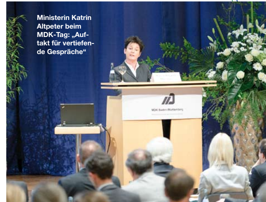
Ministerin Katrin Altpeter beim MDK-Tag: „Auftakt für vertiefende Gespräche“

Die Ministerin forderte alle Akteure auf, sich gemeinsam und konstruktiv einzubringen und an der Umsetzung mitzuwirken. Schließlich sei es nur mit einer konstruktiven Zusammenarbeit möglich, gute und nachhaltige Lösungen für die Herausforderungen im Gesundheitswesen zu finden.